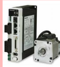
サーボアンプ/モータ