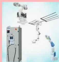
ロボットコントローラ