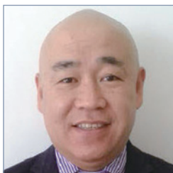
北米極 極長 安藤 至