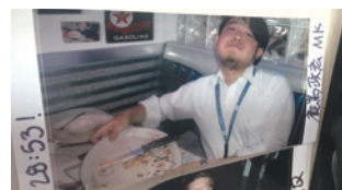
達成の証！ポラロイド写真が展示されています。

1950年代をモチーフにしたテネシーにあるハンバーガー店 "Hot Rod 50's Diner"。壁一面に張られたアンティークやポスター、いかにもアメリカらしいイルミネーションが目を楽しめます。ハンバーガーはどれも絶品ですが名物は"The CHUBBY Challenge"で、サイズはなんと33oz(900g超)。これを30分以内に完食すると特製Tシャツが進呈されます。店内のいたる所に達成者のポラロイド写真が展示されています。