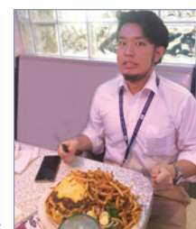
900g超えのハンバーガー