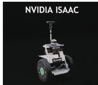
自律動作ロボティクスへの搭載