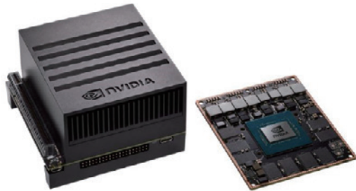
Jetson Xavier™ Development Kit及びモジュール

Jetsonプラットフォームへの最新モデル、NVIDIA® Jetson Xavier™ Developer Kitにより、GPU ワークステーションのすべての性能が30W 以下の組み込みモジュールで手に入ります。このNVIDIA Volta™駆動のAIコンピューターは自律動作マシン用に製造されたもので、NVIDIA® Jetson™ TX2と比較して性能で20倍以上、エネルギー効率で11倍以上を実現しました。現代のAIワークロードの実行および製造、流通、小売、サービス、農業、スマートシティ、ヘルスケアなどの業界向けのアプリケーション構築にはまさに理想的です。