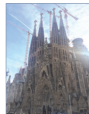
サグラダ・ファミリア