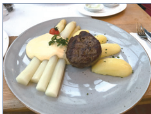
ドイツでアスパラと言えば白アスパラ