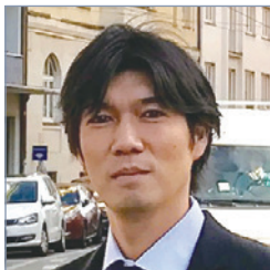
欧州極 極長 世古 昌平