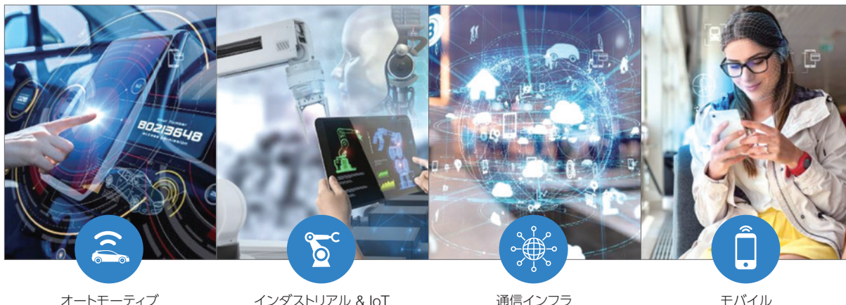
オートモーティブ