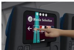
機内エンターテインメントシステム