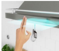
キッチン (換気扇など)