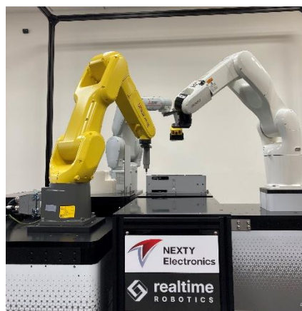
3台のロボットが共同作業をする様子